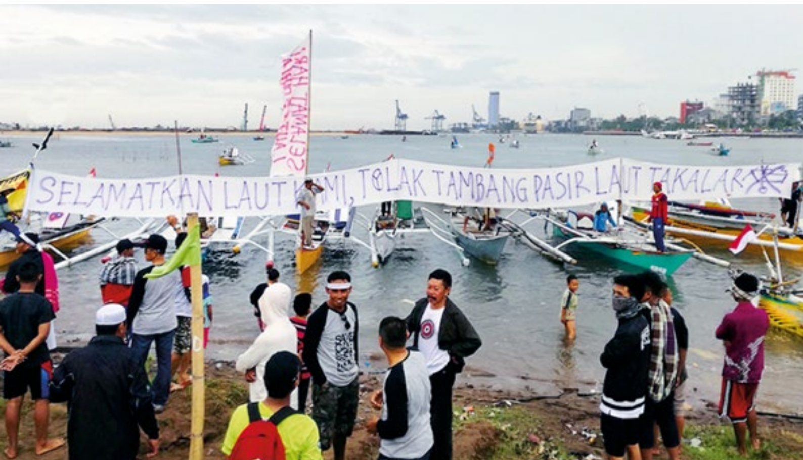
Protestaktion gegen den massiven Sandabbau

Le réseau de lutte contre l'exploitation minière Jatam continue de faire face à des défis majeurs. Au problème de l'exploitation minière dans le Sulawesi Central vient en effet s'ajouter le pillage de sable sur les côtes et dans les rivières. Par leurs vastes campagnes et manifestations, leur travail médiatique et leur pression politique, les activistes luttent contre les sociétés aux agissements illégaux et les traduisent en justice.