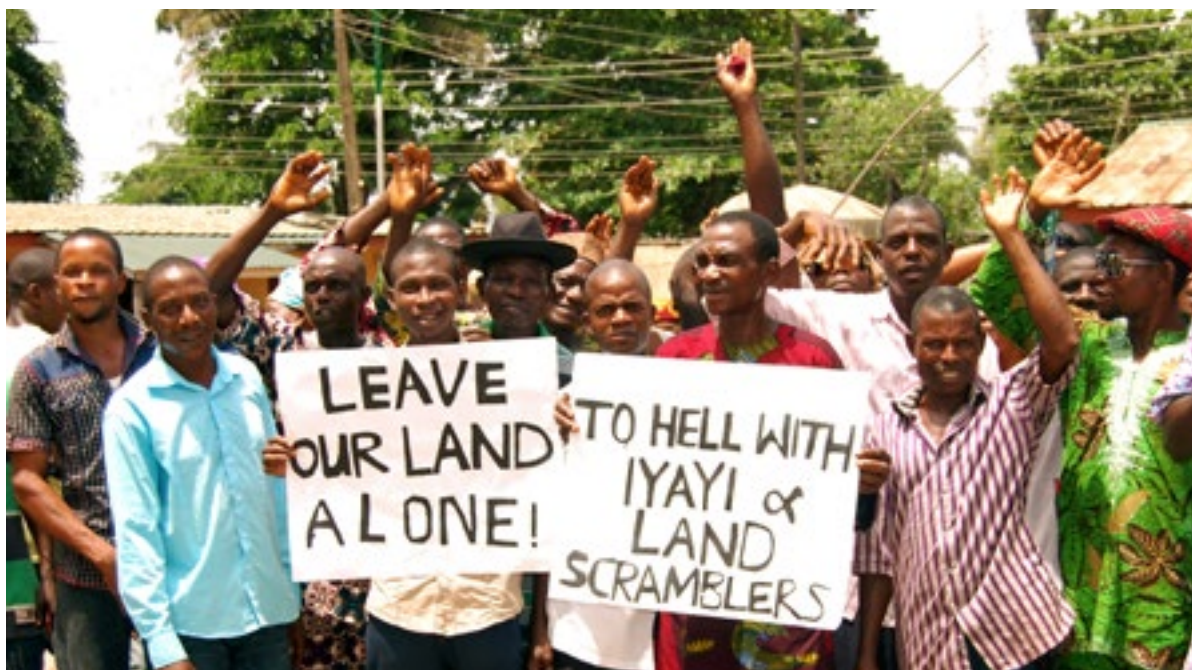
Manifestation contre le producteur d'huile de palme Okomu au Nigeria, une filiale du groupe Socfin

Tout ceci ne serait possible sans notre petite équipe et nos bénévoles. Nos collaborateurs sont en contact permanent avec nos partenaires dans le Sud, visitent des écoles, tiennent des conférences dans des universités.