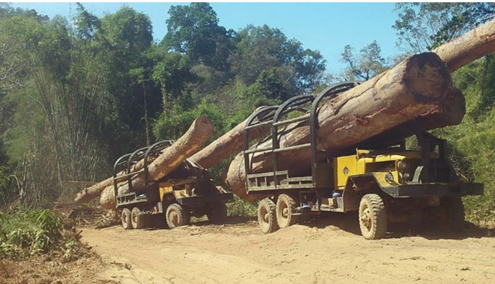
Des grumes de géants de la forêt cambodgienne en route vers le Vietnam

Les forêts de l'est du Cambodge sont pillées comme jamais auparavant : les bûcherons n'hésitent pas à sévir dans les parcs nationaux. Ils font passer le bois hors du pays par camions entiers, le long de la frontière verte vers le Vietnam. Mais les défenseurs de la forêt tropicale suivent ces criminels à la trace grâce à la mise en place d'un système d'alerte incluant les activistes des villages situés le long de la frontière. Avec ce « Forest Crime Monitoring », ils s'emploient à rassembler des preuves et se tiennent prêts à intervenir aussitôt que les pilleurs pénètrent dans la forêt.