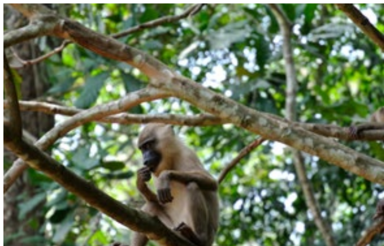
Le drill fait partie des espèces de primates menacées

Le parc national de Cross River au Nigeria, où les géants de la forêt vierge s'élançant vers le ciel, abrite des éléphants de forêt et des chimpanzés. Le sanctuaire de l'Afi Mountain est quant à lui le havre de gorilles très rares. Mais ces zones protégées sont menacées par la construction d'une route et l'établissement de plantations. Nous travaillons avec des défenseurs de l'environnement pour contrer ces deux projets imminents. En avril, nous avons rendu visite à nos partenaires et été enthousiasmés par leur engagement :