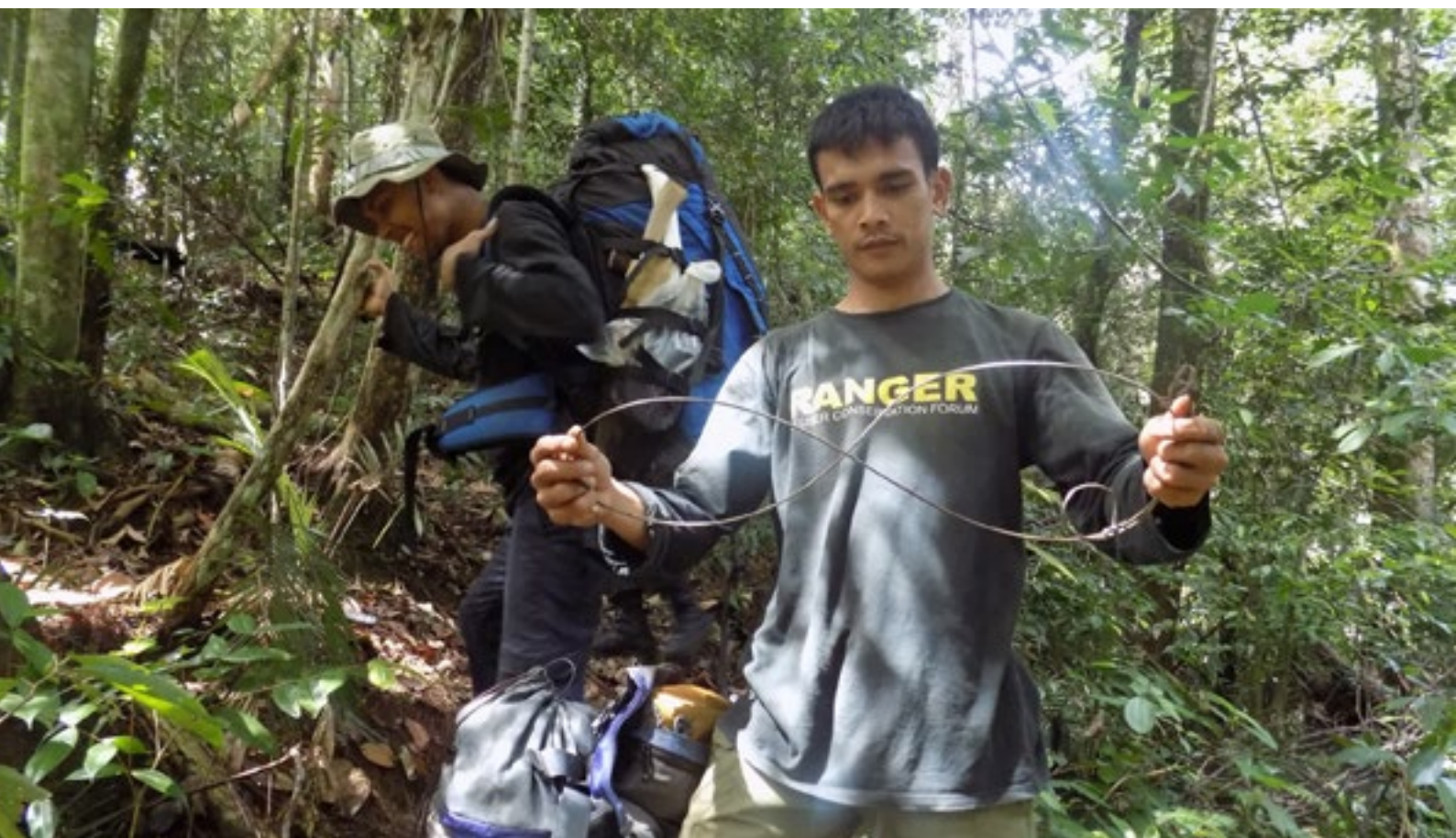
Des rangers neutralisent les pièges de braconniers dans l'écosystème de Leuser

L'écosystème de Leuser dans la province d'Aceh au nord de Sumatra et les forêts vierges de Sabah sur l'île de Bornéo (Malaisie) ont un point commun : des paysages de forêt tropicale continus et largement intacts abritant la grande faune du Sud-Est asiatique, à savoir éléphants, rhinocéros, orangs-outans, tigres de Sumatra, ours malais ainsi que de nombreuses autres espèces ayant survécu jusqu'ici.