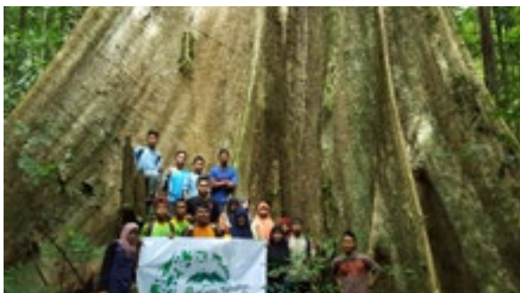
Photo de couverture : groupe de jeunes défenseurs de l'environnement devant un arbre géant au parc national de Leuser sur l'île de Sumatra en Indonésie