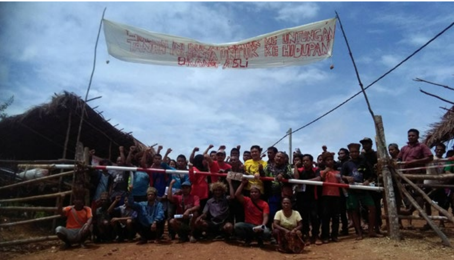
Les Temiar font barrage aux bûcherons